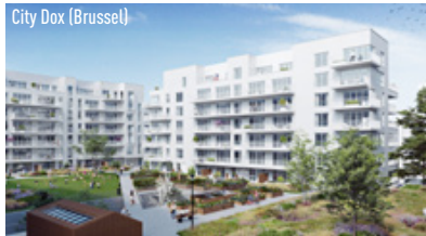
City Dox (Brussel)