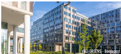
VACI GREENS - Boedapest

ATENOR is een vennootschap voor vastgoedpromotie met beursnotering op Euronext Brussels. Haar missie is erop gericht om via haar stedenbouwkundige en architecturale aanpak gepaste antwoorden te bieden op de nieuwe eisen die de evolutie van het stads- en beroepsleven stelt. In dit kader investeert ATENOR in vastgoedprojecten van formaat die beantwoorden aan strenge criteria inzake ligging, economische efficiëntie en respect voor het milieu.